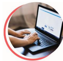
Ateliers en ligne