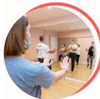
Activité Physique Adaptée