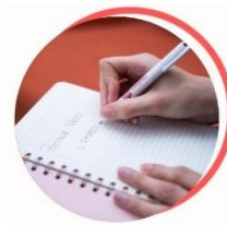
Maintien et retour à l'emploi